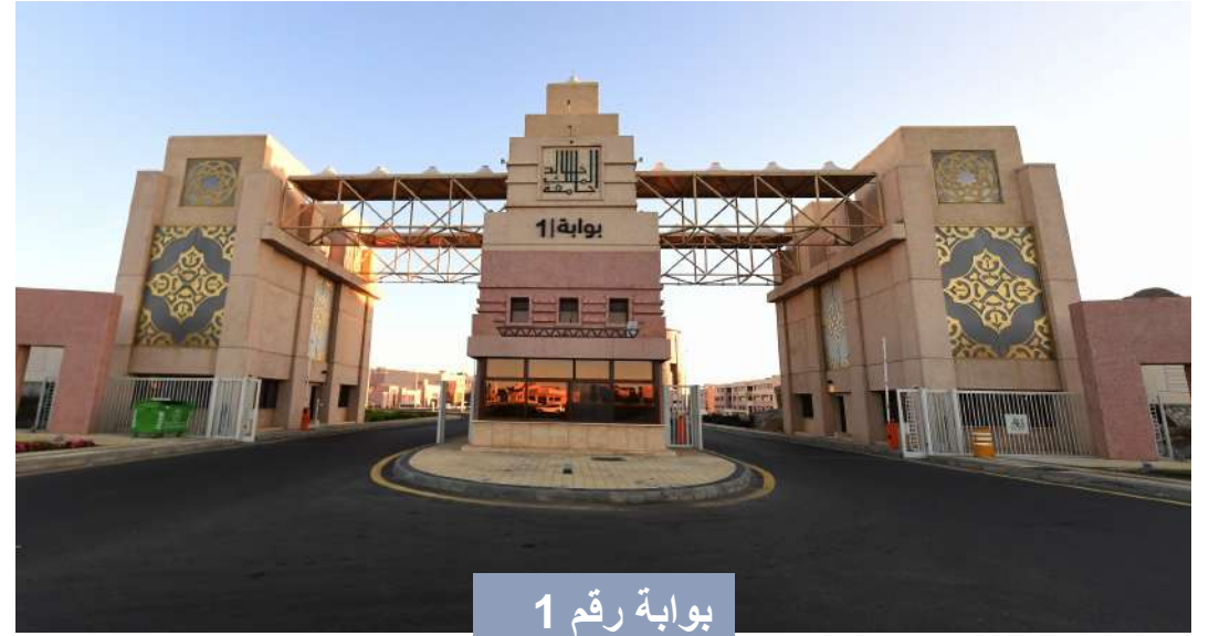
بوابة رقم 1