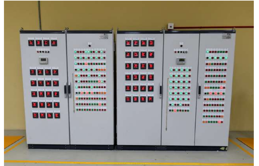
محطة الكهرباء الجنوبية