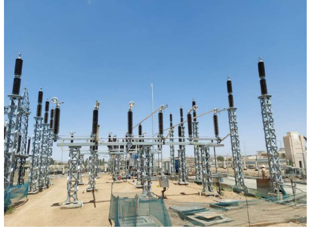
محطة الكهرباء الشمالية