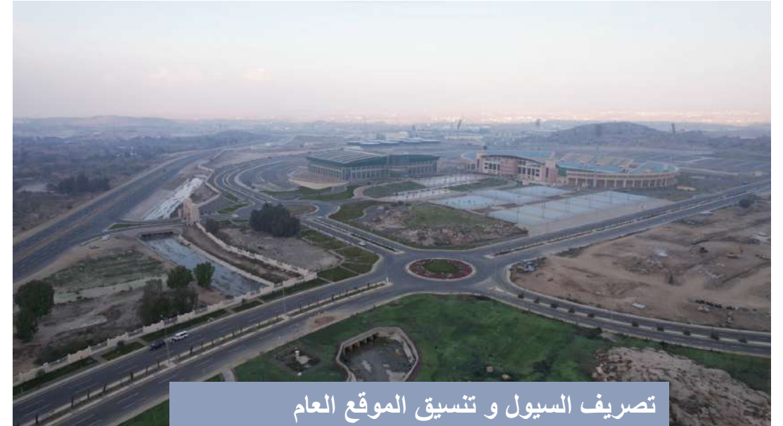
تصريف السيول و تنسيق الموقع العام