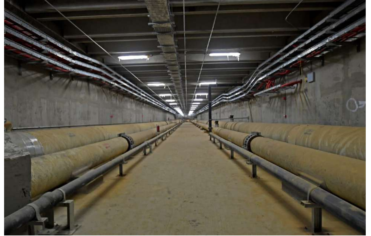
الأنفاق الرئيسية والفرعية