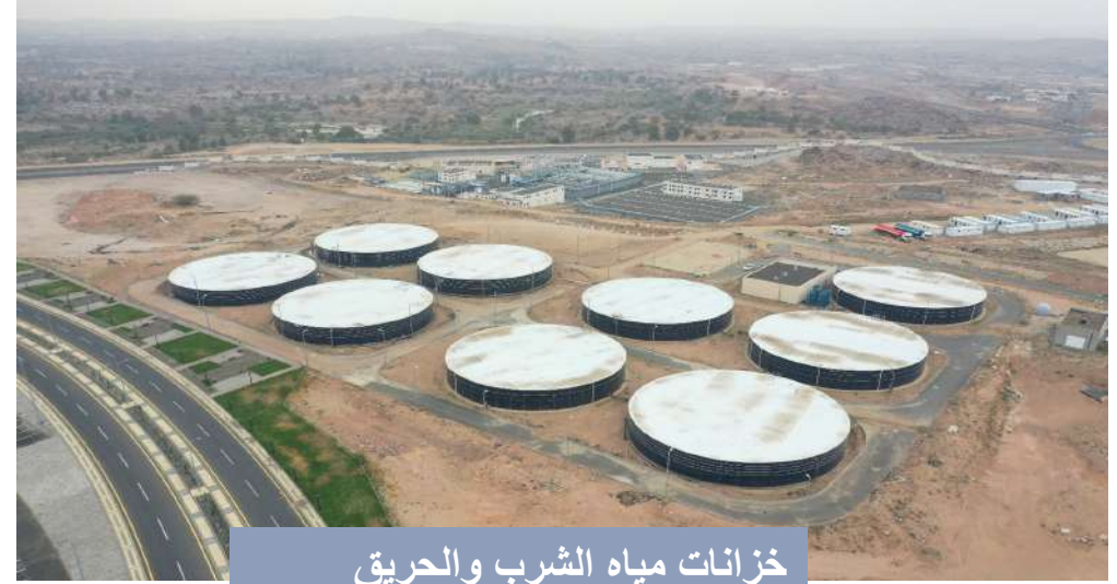
خزانات مياه الشرب والحريق